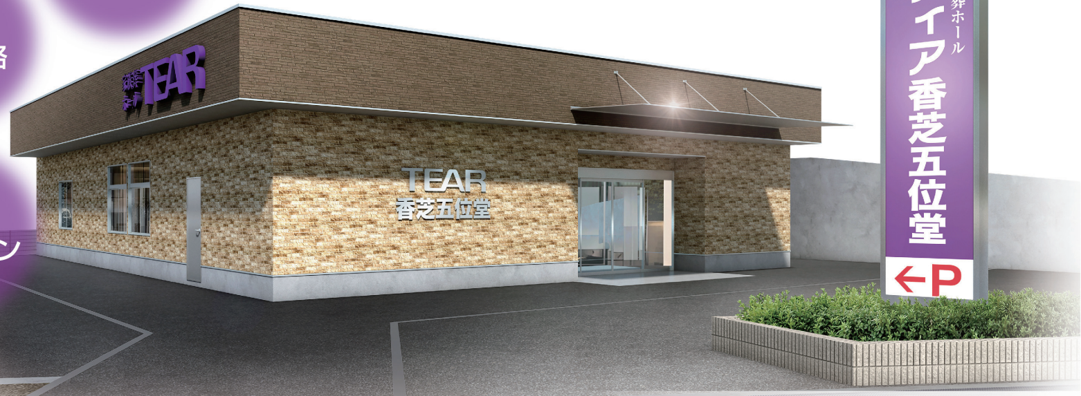
家族葬ホール ティア香芝五位堂 外観イメージ