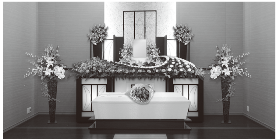
家族葬用祭壇は、10:00~15:00の間、ご自由にご覧いただけます。