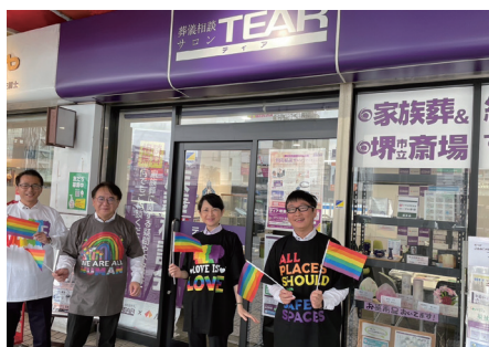
「LGBTQフレンドリー宣言」に際し、ティア塚東（葬儀相談サロン）前で撮影する同社スタッフ

ですよね。しかし、このままの状況であってはいはざがありません。当社は、“あらゆる人と共感し感動葬儀をクリエイトする”ことをビジョンに掲げておりますので、その信念のもと、性の多様性に配慮したお見送りの提供や職場環境の整備など、多様性を受け入れる土壌づくりを行なうことは必然の流れでもあります。