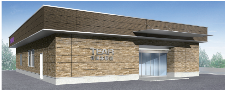
今秋開業予定の「ティア富田林駅前」外観