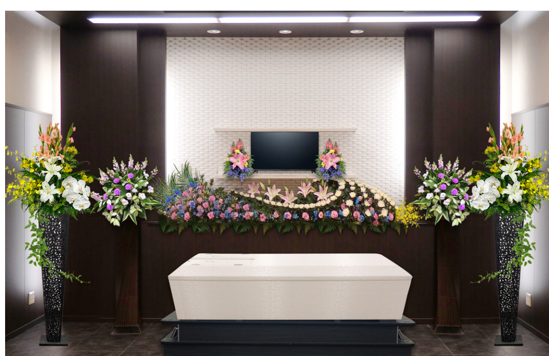
プレミアムサルビアセット