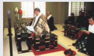
年2回の法要(春・秋)を実施

合葬墓・永年管理墓・永代使用墓についてのお問い合わせ お墓についてのご相談はこちらから