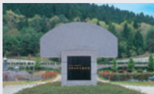
霊園内に佇むモニュメント