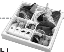
※画像はイメージです。